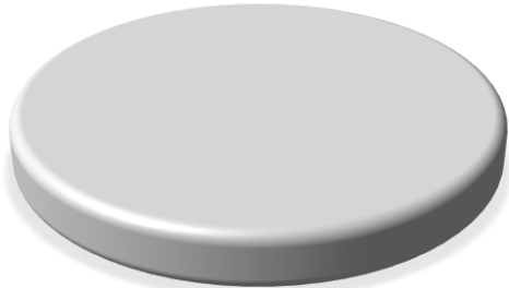
LICITACIÓN PÚBLICA 100%